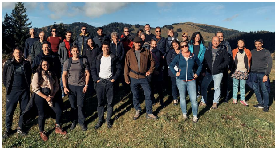
Die idyllische Landschaft der Schwägälp lädt zu vielfältigen Outdoor-Aktivitäten ein.

Aus aktuellem Anlass wurden in diesem Jahr keine externen Referentinnen und Referenten eingeladen. Stattdessen setzte sich das HKV-Team am Freitagmorgen in kleinen, fachschafts- und abteilungsübergreifenden Gruppen mit zentralen Aspekten der KV-Reform auseinander. Dazu zählten Fragen rund um die Themen selbstorganisiertes Lernen (SOL), Moodle-Lernpfade, Portfolioarbeit und Gestaltung der ersten Ausbildungswoche. Aber auch grundlegende Fragen wurden diskutiert: Welche Organisations- und Unterrichtsformen werden in Zukunft nötig sein? Wie sollen die Räumlichkeiten an die neuen Begebenheiten angepasst werden? Profitieren konnten die Gruppen von den Vertreterinnen und Vertretern des Detailhandels, welche aufgrund ihrer ersten Reform-Erfahrungen Anschauliches zu berichten wussten. Nach der ausführlichen Präsentation der Gruppenergebnisse stellte Rektor Raphael Kräuchi zufrieden fest, dass viele frucht-