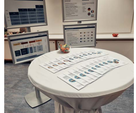
Neue Inhalte - neues Werbematerial. Die KV-Reform nimmt Fahrt auf.

ungebrochen hoch ist. Leider bieten derzeit immer noch viel zu wenige Betriebe Mediamatiker-Lehrstellen an. Um dem entgegenzuwirken, wird der kantonale Branchenverband ICT Berufsbildung Schaffhausen seine Marketingbemühungen weiter ausbauen. Um dem Nachdruck zu verleihen, auch in diesem Jahr der Aufruf: Wagen Sie als KMU oder Grossbetrieb den Schritt und schaffen Sie Mediamatiker-Lehrstellen! Der Beruf ist zukunftsgerichtet und Sie werden davon profitieren!