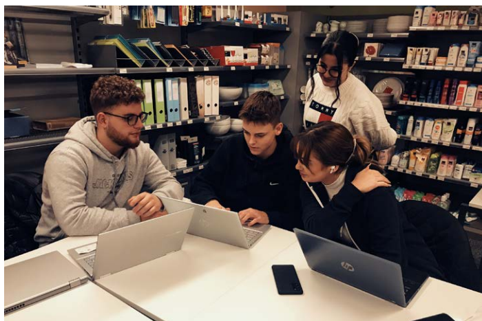
Links: Gruppenarbeit im Praxisraum Rechts: Prämierung prix.vision 2022

fordert ein Umdenken und ein Sich-Einlassen auf Neues. Der Aufwand ist und bleibt enorm. Vielen herzlichen Dank für euren grossen Einsatz, eure Geduld und eure Offenheit. Ohne dieses Engagement und euren Rückhalt wäre die Umsetzung der Reform in dieser viel zu kurzen Zeit unmöglich gewesen. ■