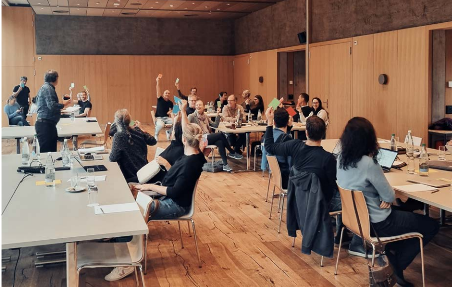
Das Lehrerkollegium im Sprint zur Umsetzung der KV-Reform.