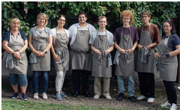
Das Team der Schulverwaltung im Kochstall Gächlingen im September 2022.