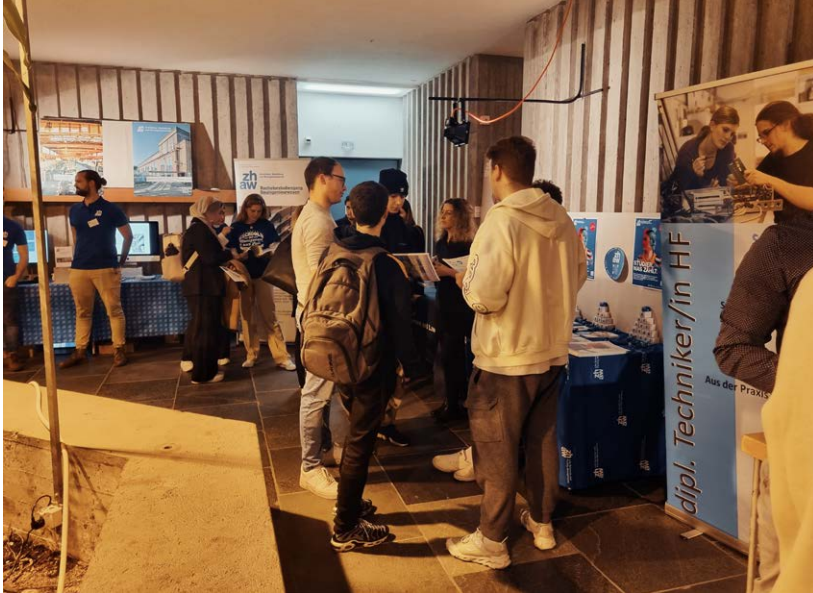
Neuland – Die 1. BM-HF-FH-Messe in Schaffhausen

aufenthalt im Sommer konnte wiederum erfolgreich durchgeführt werden. Erfreulich zeigte sich das Angebot für das einjährige Praktikum im Abschlussjahr: Immer mehr Unternehmen bieten einen Platz an. Ein riesiges Dankeschön an dieser Stelle an die entsprechenden Betriebe!