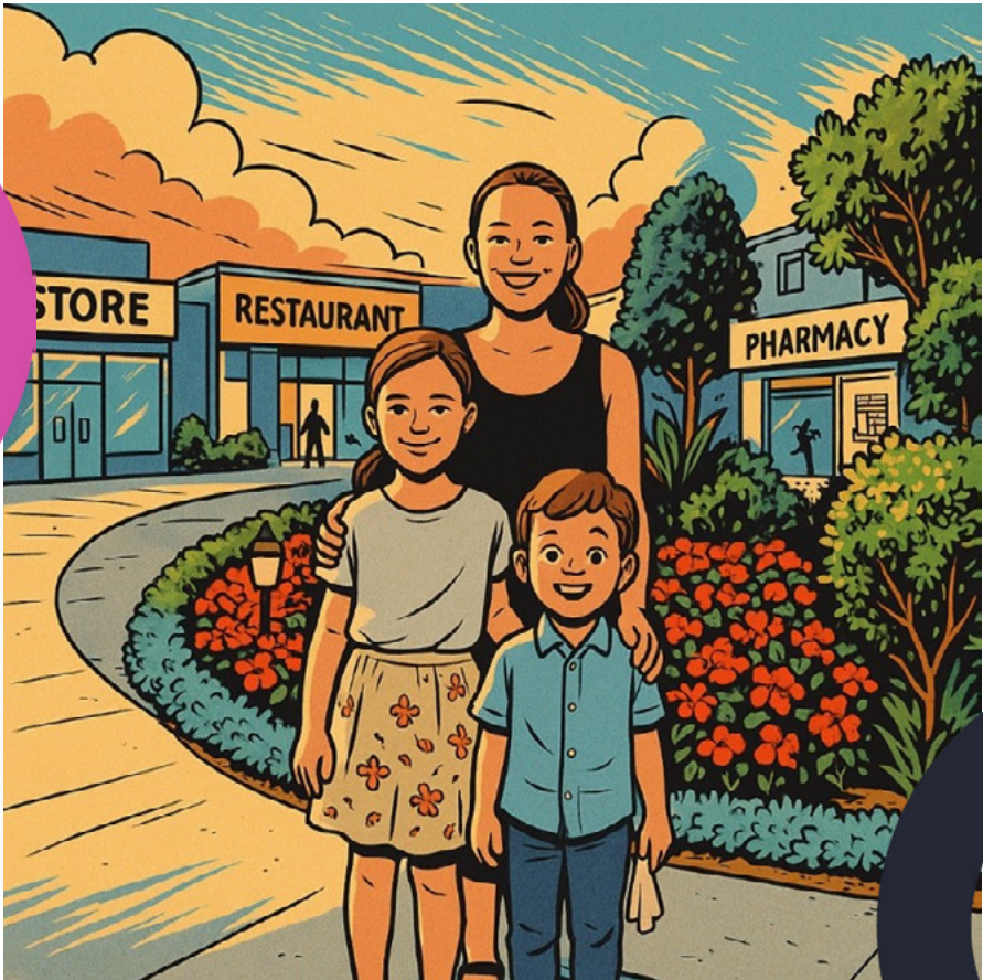
Fotografie als Comic mit KI dargestellt

Der KV Ostschweiz setzt sich kontinuierlich mit den zentralen Herausforderungen des digitalen Wandels in der Arbeitswelt auseinander.